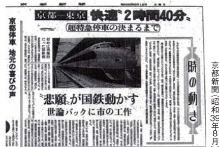
京都新聞(昭和39年8月)

当時の京都市民や経済界、行政など、京都全体が大きく動いたことによって、国鉄が計画を見直し、東海道新幹線の「京都駅停車」が決まったのよ。「ひかり」も、最初は名古屋までの停車予定だったのよ。