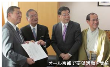
オール京都で要望活動を実施

近年、経済格差や文化・宗教の違い等による争いが世界各地で起こる中、「和」を重んじる日本文化の価値が改めて見直され、その発信がこれまで以上に重要になっています。そこで、京都市では、京都府、京都商工会議所等とともに、平安京の古(いにしえ)より我が国の文化を育み、日本の精神文化の原点ともいべき京都に文化庁を移転することにより、京都を軸として日本文化を創生することを目指して取り組んでいます。日本の将来を見据えて、多くの皆様のご理解、ご協力をお願いいたします。