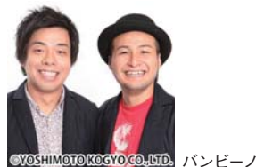
YOSHIMOTO KOGYO CO., LTD. バンビーン

リニア中央新幹線と北陸新幹線の京都駅誘致に関するPRイベントと、キング・オブ・パフォーマー決勝戦が開催されるの。今年は、大人気の芸人「バンビーン」のお笑いライブが見られるわ！し・か・も！バンビーンの直筆サイン入りグッズのプレゼント企画もあるみたいよ！