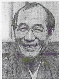
門川大作(かどかわだいさく) 1950年京 都市生まれ。立命館大学二部法学部卒。京 都市教育長を経て、2008年より、市長。世界 歴史都市連盟会長、文部科学省中央教育審議 会各分科会委員等を務める。趣味は「人間学」仕 事を楽しむこと。

えば和食は京都の象徴であつて も、昆布は北海道、かつお節は高 知から。また、蕎麦は福島県の川俣な ど、日本中の別の土地から入つて くる。あらゆる文化も伝統産業も 全国各地とつながり、支え合つて います。一千年の間そういうネッ トワークの中心が京都でした。そ んな京都が新しい国土軸から外れ るのはいかなものか。現状で も東京から2時間20分なので十分 だろうという意見もあります。で すが、リニアができたなら「のぞみ」 の本数は激減することになって、 東海道新幹線は一種のローカル線 になってしまうでしょう。