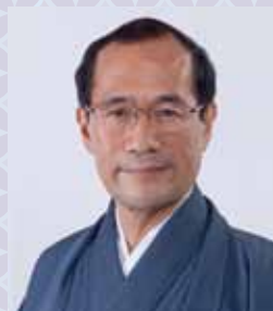
門川 大作 京都市長